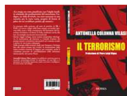
Copertine fronte retro del libro Cliccare per ingrandire

forzare gli strumenti giuridici, riuscendo così a preservare il paese dai mali maggiori per i quali i terroristi operavano. Essi infatti sono riusciti a compiere i loro delitti – e tante vittime innocenti sono state immolate – ma non a travolgere la Repubblica, come era invece negli intendimenti, interni ed internazionali, dei fautori e degli esecutori di tanti delitti, e il libro si occupa di questi ultimi. Di fronte a tanto